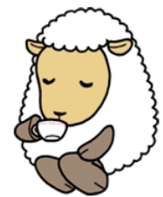
文責：沈黙のひつじ